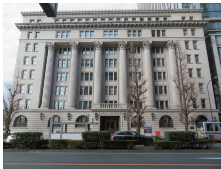
めいじせいめいかん 明治生命館