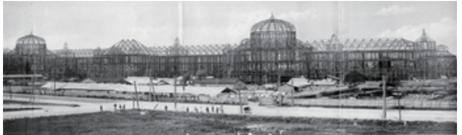
けんせつちゆう どうきょうえき 建設中の東京駅