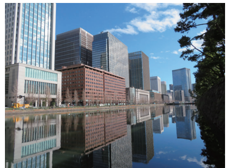
まる うちしゅうへん こうぎょ ほり 丸の内周辺のまちなみと皇居のお濠

答2 たてもん むかし てどうえき つか かいふう めいじ ねん ねん まえ この建物は昔、鉄道駅として使われていたよ! 開通は明治 45(1920)年、100 年も前なんだ!