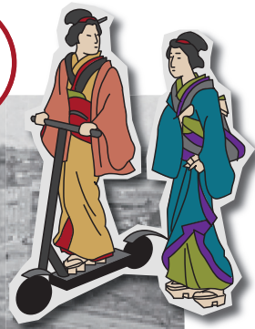
むかし まる うち みつばしだいいちごうかんびじゅつかん 昔の丸の内のまちなみ(三菱第一号館美術館など)