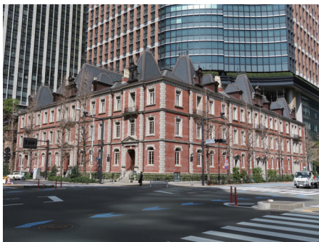
みつばしだいいちごうかんびじゅつかん 三菱第一号館美術館