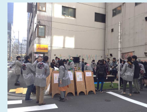
お祭りにも使える広場