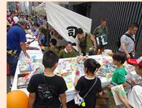
子どもを巻き込んだつながり