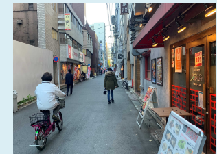
生活に根差した通り