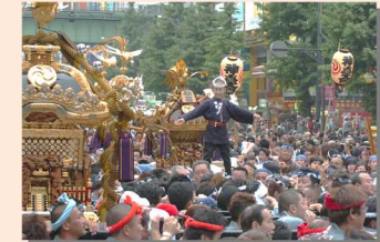
昔から続くつながり