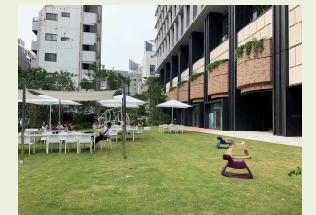
人を惹きつける公共空間活用