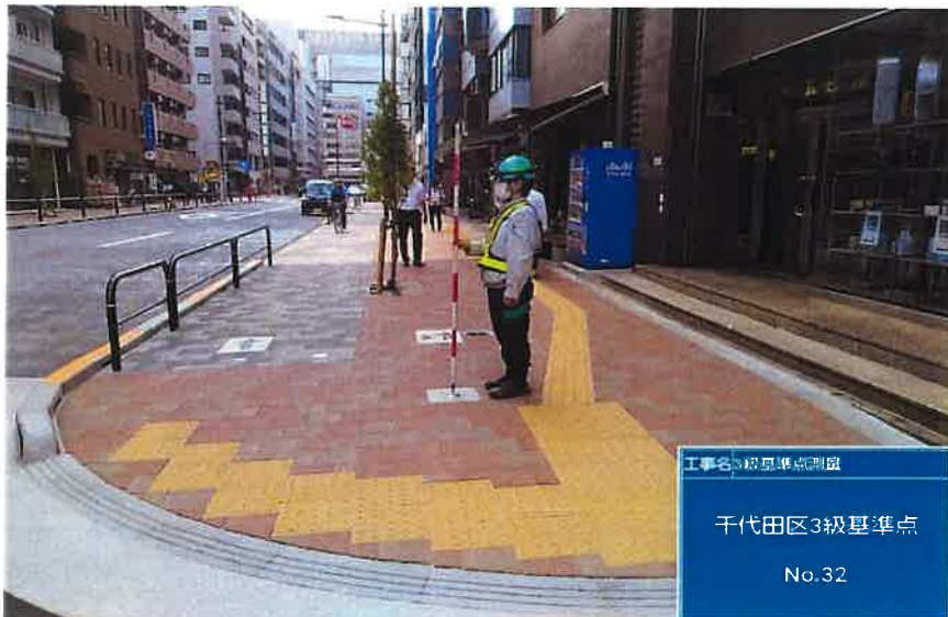
工事名 標高基準点設置 千代田区3級基準点 No.32