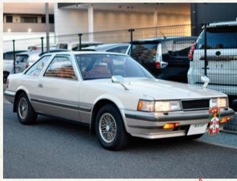
昔は、しめ縄かざりをつけた車もよく見かけた

1年の始まりとして現在でも特別な意味を持つ正月。かつては「五穀豊穡をもたらす『年神様』を家々にお迎えする行事」とされていました。旧暦(太陰暦)を採用していた当時の正月は立春のころ。新しい命が芽吹く時期でもあり、新しい年の命を人々に与える年神様を迎える正月の行事は重要な意味を持っていました。門前に飾られる門松は年神様が家に来る際の目印、しめ縄は年神様を迎える神聖な領域であることを示し、不浄なものが入らないようにする意味合いがあるのです。