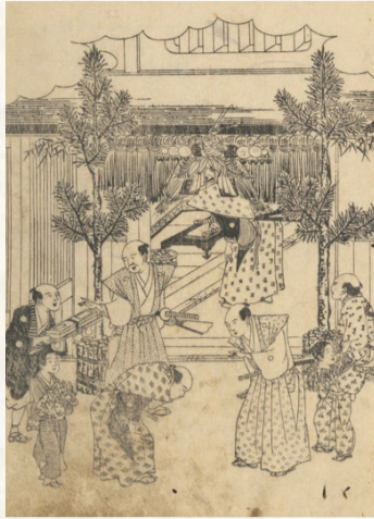
「諸国図会年中行事大成」

江戸時代の正月は、町人が丁稚を連れて親族や知人宅を回る。この際にお年玉として扇を贈っていたという