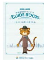
▲参加者には売買の流れがわかるガイドブックを差し

不動産の売却について悩んでいる人や知識を得たい人は、この機会に参加を。不動産の無料価格査定相談にも応じてくれます。