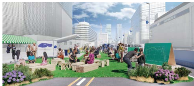
「GINZA SKY WALK 2024」イメージ