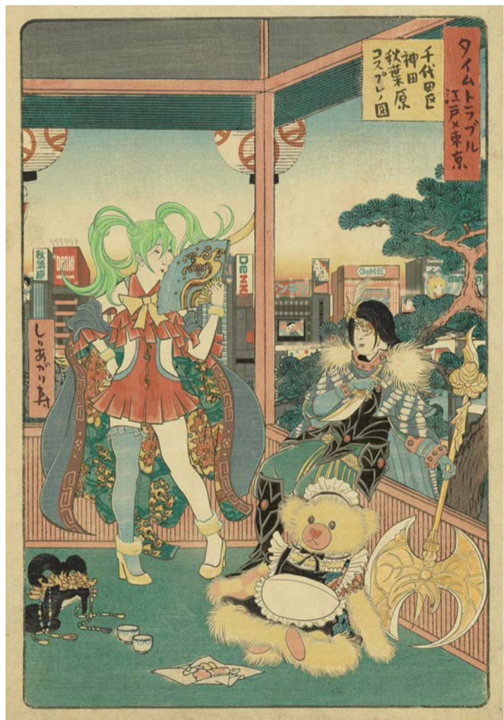
しりあがり寿「千代田区神田秋葉原コスプレノ図」令和6年(2024)

昭和33(1958)年生まれ。多摩美術大学を経て昭和60(1985)年「エレキな春」で漫画家としてデビュー。ギャグから社会派まで幅広いジャンルの作品を手がける一方、映像、現代アートなどの多方面で活躍。平成26(2014)年紫綬褒章を受章