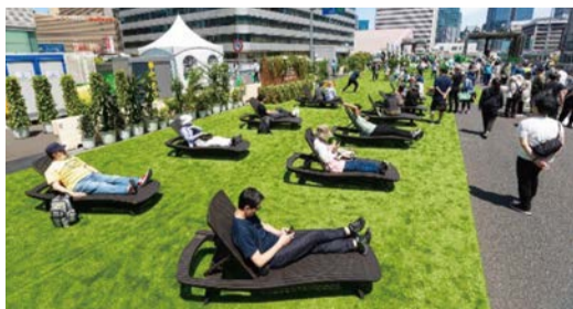
前回のイベントの様子(デイベット)

☆掲載している情報のうち新年度のものは、原則として新年度予算の議決ののちに行われる予定です☆