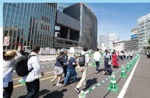
前回のイベントの様子(ウォーキングガイドツアー)