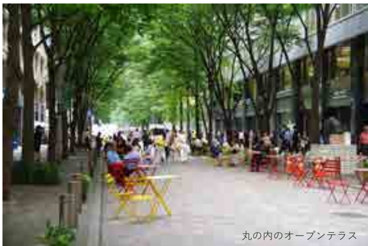
丸の内でのオープンテラス