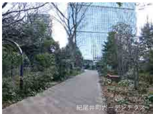
紀尾井町ガーデンテラス