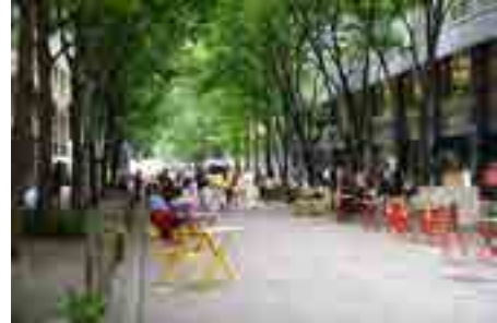
■ 道路を歩道と一体的に活用 緑があふれ、ひとがリフレッシュできる 空間づくり

千代田区が進める「ウォークラブルまちづくりデザイン」に生物多様性の視点を積極的に導入し、自然とふれあえる場を提供するようなまちづくりを多様な主体と連携して進めます。