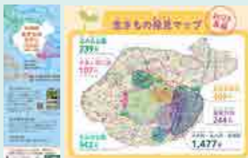
■ 左：2023年春編・夏編の案内 右：2023年春編の結果：発見マップ

千代田区内に生息・生育する生きものの現状確認と区民の生物多様性への関心を高めることを目的として、2014（平成26）年から毎年、継続して実施しています。区民・在勤・在学・来訪者など、どなたでも参加できます。生きものさがしの結果は、区のホームページで公表されており、例年多くの情報が寄せられています。今後、これらの情報を蓄積、情報公開し、区民のみなさんも取り組める生態系ネットワークの強化や希少種・外来種対策に活用していきます。