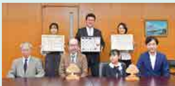
■ 令和4年度受賞者の皆さんと審査員