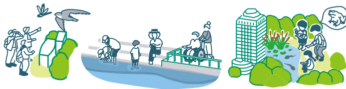
■ 自然観察会など自然教育の場の創出

環境保全団体には、各主体と相互に連携しながら、活動のリーダーとして地域の自然教育や生物多様性に関する体験学習の機会を広く提供し、活動を普及させていくことが求められます。また、地域の生きものや環境に関する情報を積極的に収集・発信するとともに、環境保全について主体的に行動できる人材を育成することが期待されます。