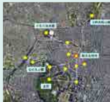
■ 野鳥が利用していると見込まれる主要な緑の回廊網

駿河台緑地は令和5年10月に環境省の自然共生サイトに認定されました。千代田区はこのような自然共生サイト等の認証緑地を増やす取組みを推進していきます。