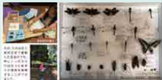
■ 令和4年度受賞 標本づくりや比較を行った 「千代田区と東京近郊の昆虫生息調査」