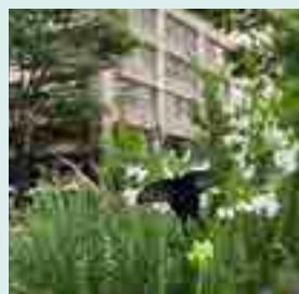
■ まちなかにつくられた花壇に飛来するクロアゲハ

ビオトープは「生物の住む空間」という意味の言葉です。日本では環境再生で作り出した空間を指すことが多く、市街地ではよく水辺環境が再生されるため、ビオトープには水辺のイメージがあります。しかし、生物が住む空間は草の生えたプランターでも植木鉢でも作り出せるのです。規模の小さなビオトープでもつながり合えば、広い生息空間があるのに近い状態になります。