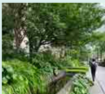
■ ホトリア広場 (自然共生サイト・ ABINC 認証緑地・ SEGES 認証緑地)