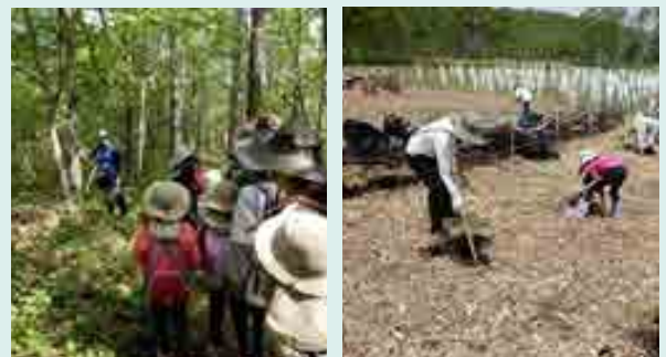
■ 植樹ツアーの様子

また、嬭恋村との共催事業として森林保全を図り、森林の役割や大切さを学ぶことを目的とした「ちよだ・つま恋の森づくり」植樹ツアーを平成24年度から実施しています。令和2年度からは新型コロナウイルス感染症拡大の影響で中止になりましたが、令和4年度に3年ぶりに開催し、令和5年度で10回目の開催となりました。