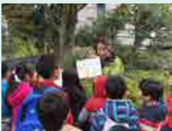
■ 駿河台生きものさがし自然塾

駿河台緑地内には野鳥を記録するための自動撮影モニタリングカメラを5カ所に設置しています。この記録と毎月のバードウォッチングで観察できた野鳥の記録をもとに、駿河台緑地が野鳥の移動に寄与するエコロジカルネットワークとして機能しているかどうかを分析しました。