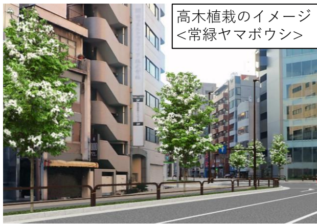
高木植栽のイメージ ＜常緑ヤマボウシ＞