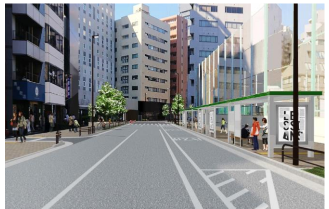
バス上屋設置イメージ