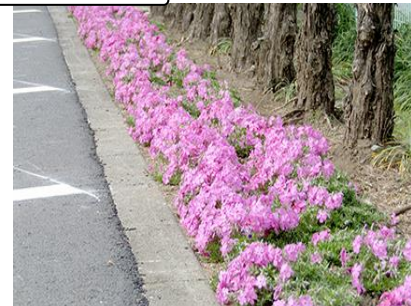
整備事例：新荒川大橋緑地（東京都 北区）