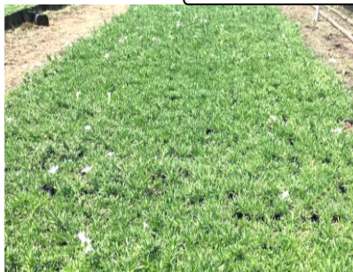
シバザクラ（参考写真）