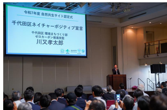
↑区がネイチャーポジティブ宣言を行った「令和7年度自然共生サイト認定式」での様子