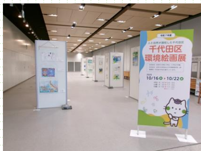
昨年の環境絵画展