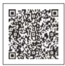
▲負担軽減申請フォーム