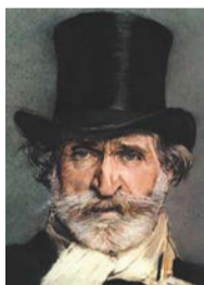
ジュゼッペ・ヴェルディ (1813年~1901年)

時5月21日(木)19時~20時30分 場日比谷図書文化館(日比谷公園1-4) 定60名(申込順) 内名作と言われるヴェルディの「ファルスタッフ」の魅力をさまざまな角度から再発見する 師小畑恒夫氏(日本ヴェルディ協会理事長) 費1,500円 他主催=フェニーチェ劇場友の会