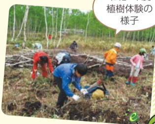
令和7年度植樹体験の様子

時5月23日(土)・24日(日)(1泊2日/雨天決行) 集合・解散 区役所前(集合=7時30分、解散=17時30分) 宿泊先 東海大学孺恋高原研修センター(群馬県吾妻郡孺恋村大字千俣2401) 対小学3年生以上※3時間程度の自然散策ができればそれ以外の方も応募可(未就学児は不可/中学生以下は保護者同伴) 定9組(抽選/1組2名~6名、最大35名、ちよエコヒーロー宣言登録による優先あり) 内23日=地元ガイドと自然観察をする、24日=孺恋村棧敷山で植樹体験をする※雨天変更する場合あり 費大人1万円、小学生5,000円(いずれも傷害保険料を含む) 申4月22日(水)17時までにHPから 問(株)旅屋・和田☎03-6228-0852