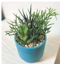
直径10cm×高さ10cm程度の鉢に植える

■ハッピーハンドメイド 多肉植物 時5月20日(水) 18時30分~20時 場九段生涯学習館(九段南1-5-10) 定8名(申込順) 内3種の多肉植物の寄せ植えを作