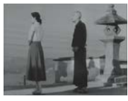
東京物語

時 東京物語＝5月11日(月)・18日(月)、美しき小さな浜辺＝5月13日(水)・20日(水)いずれも10時～(当日直接会場へ) 場 かがやきプラザ4階和室(九段南1-6-10) 対 区内在住者 定 20名(先着順) 問 かがやきプラザ研修センター☎03-6265-6560