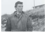
美しき小さな浜辺