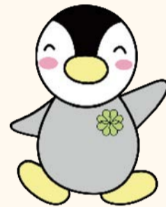
東京都民生委員・児童委員 キャラクター「ミンジ」