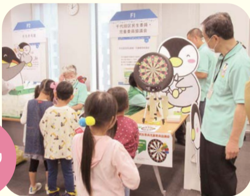
ふれあい福祉まつりへの参加

地域のイベントや学校行事などへの協力や参加を通じて、地域の皆さんとの交流を深めています。