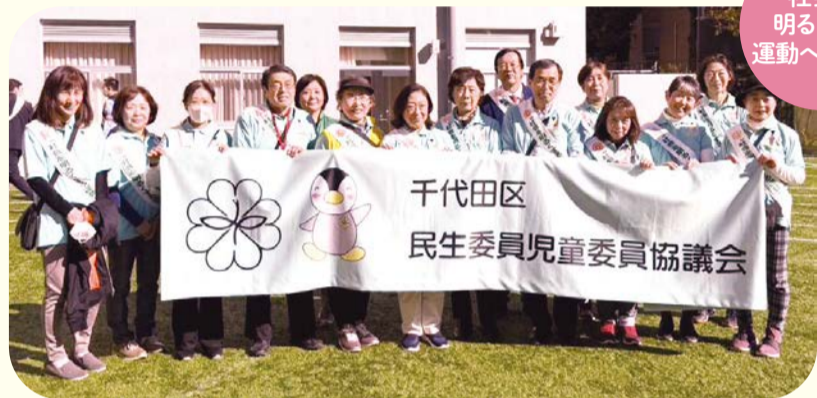
社会を明るくする運動への参加