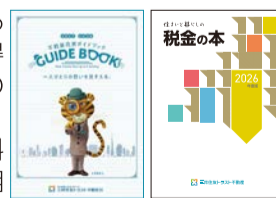
▲参加者には不動産売買ガイドブックと住まいと暮らしの税金の本をプレゼント

て悩んでいる人や知識を得たい人は、この機会に参加を。不動産の無料価格査定相談にも応じてくれます。