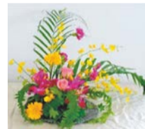
写真はイメージ 高さ約30cm、横約30cm

時6月27日(土) ①10時~11時30分②13時~14時30分③15時30分~17時 場千代田万世会館(外神田1-1-7) ※万世橋区民館とは異なる 定①8名②7名③6名(いずれも申込順) 内南国調の花とグリーンで初夏のアレンジメントを作る