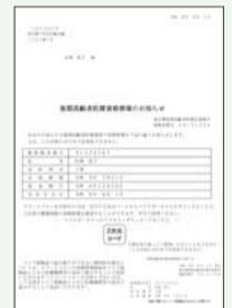
▲資格情報のお知らせ