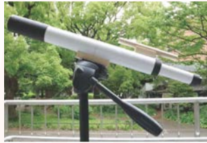
▲手作り望遠鏡(三脚は含まない)

他 持ち物=ビデオまたはデジカメ用の三脚(1mくらいの物)、持ち帰り用の袋(望遠鏡の長さは45cm程度)