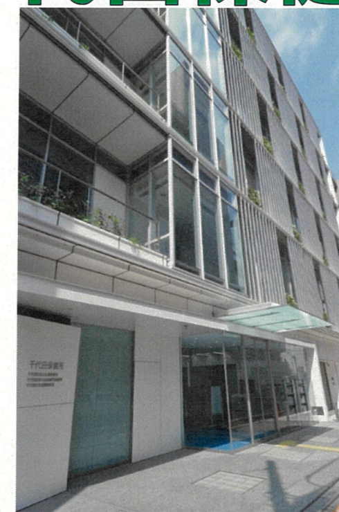
千代田保健所庁舎