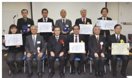
▲昨年度表彰式の様子

無料相談会 まちみらい千代田では「マンションの維持管理に関する相談」の充実を図るため、「首都圏マンション管理士会 都心区支部」の協力を得て、マンション無料相談会を行っています。 現在、毎回4名のマンション管理士が皆様の相談をお受けしています。お気軽にお申し込みください。 ※相談は1回30分程度、予約の方を優先します。 なお、マンションでの日常生活や建物の維持管理等のご相談、マンションに関する各種助成制度の申請についての相談等は、随時受け付けております。