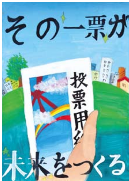
▲平成23年度「明るい選挙」啓発作品コンクール 千代田区明るい選挙推進協議会会長賞