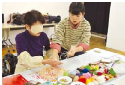
▲ポコラート全国公募展 vol.3 ブラインドアートワークショップ (アーツ千代田 3331)