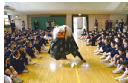
▲伝統文化にふれる会(お茶の水小学校)