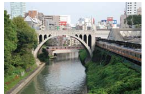
▲震災復興橋梁である聖橋

者の氏名・住所・電話番号、参加者全員の氏名も記入)で千代田区観光協会(Fax) 3556-0392 (entry@kankochiyoda.jp)へ。 問 ☎ 3556-0391