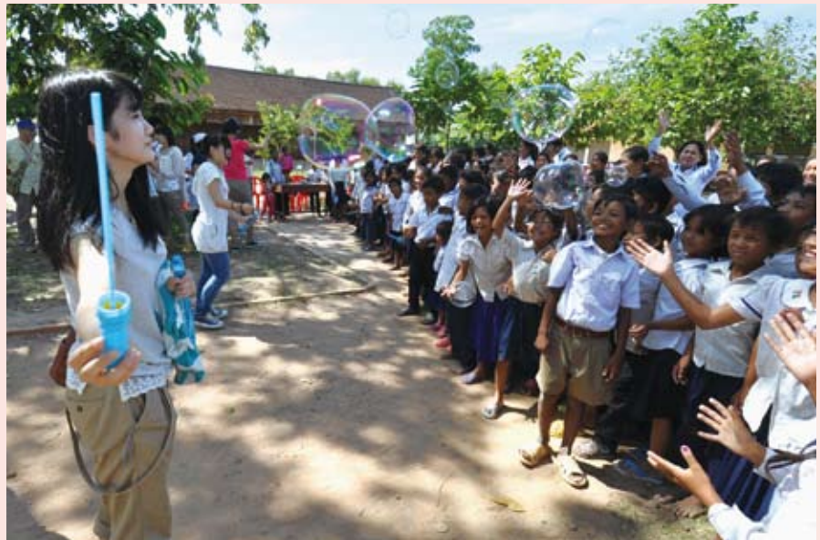
③ 現地の小学生との交流