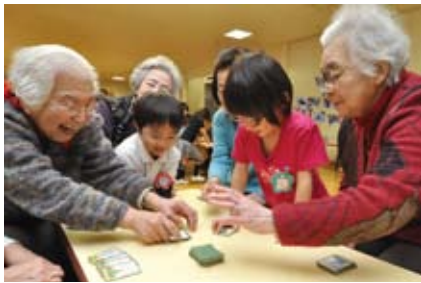
▲音遊び交流会(千代田幼稚園)