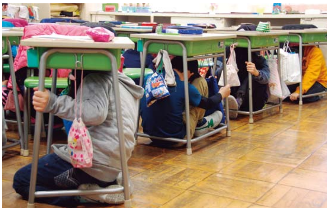
▲地震発生時は、机の下などに隠れ、まず身の安全を確保することが大切です。

3月11日で東日本大震災から2年が経ちます。区は、大震災の教訓を忘れず、地震発生時の「自助」の大切さを啓発するため、3月11日(月)の帰宅困難者対応訓練の冒頭で、13時から一斉防災訓練(シェイクアウト訓練)を実施します。この訓練を各家庭や職場等で実施し、日頃の防災対策を再点検しましょう。