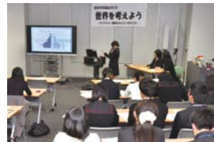
▲ちよだ地球市民ツアー報告会