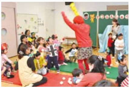
▲節分集会(ふじみこども園)