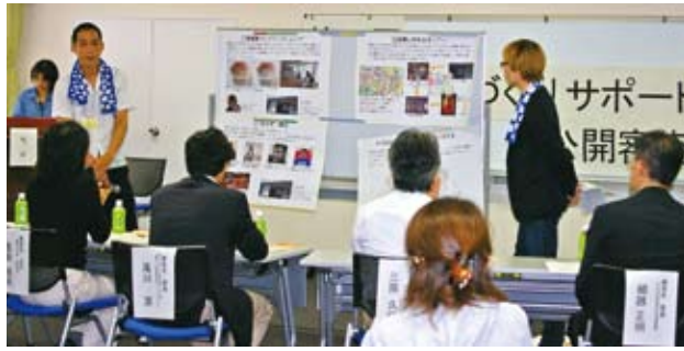
▲公開審査会の様子