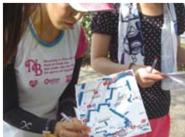
▲週末ランニング皇居走ろうぜ!のマップ作り

市民によるまちづくり活動を応援する「千代田まちづくりサポート」事業では、今年度の助成を受けた全4グループによる活動成果発表会を開催します。