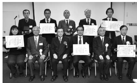
▲昨年度表彰式の様子