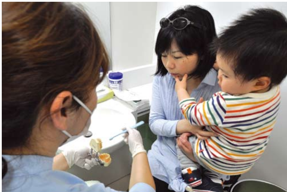
▲歯科保健相談での歯磨きのアドバイス