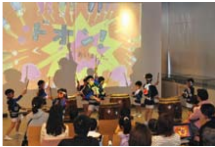
▲「ことばと音のフェスティバル」での絵本の朗読と太鼓演奏(区民ホール)