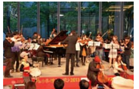
▲ラ・フォル・ジュルネ・オ・ジャポン『熱狂の日』音楽祭2013(東京国際フォーラム)