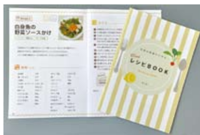
▲参加者には、タニタのミニレシピブックを差し上げます。