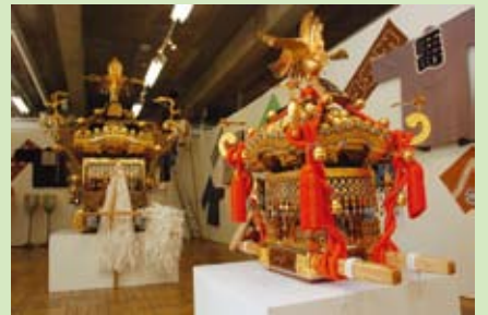
▲アーツ千代田 3331 特別企画展で展示された神輿

日(月)～6月2日(日)に放映します。 ※開局地域で、ケーブルテレビに加入している方がご覧になれます。 区広報広聴課 ☎ 5211 - 4172 申 http://www.city.chiyoda.lg.jp