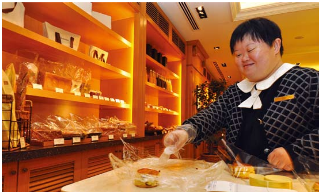
▲おもてなしの心で商品を準備(ザ・ペニンシュラ東京)

彼女はとても明るく、丁寧に仕事をします。教えられることも多く、いい刺激を受けながら一緒に仕事をしています。彼女は職場にとって頼りになる存在です。また、障害者を雇用していくには、行政等のサポートを受けることも大事ですね。