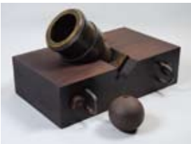
▲13ドイムハンドモルチー ル砲・砲弾 幕末明治 板橋区立郷土資料館所蔵

会津のジャンヌ・ダルクと呼ばれた山本八重は、慶応4年(1868年)の戊辰戦争の会津籠城戦で、アメリカ輸入の連発スパンサー銃を使用して官軍側に対抗した女傑でした。彼女がなぜ鉄砲を構えることになったのか、幕末期の砲術・軍事制度を中心に、その歴史的背景を考えます。 時 12月26日(木)19時～20時30分(受付18時30分～) 場 4階スタジオオプラス(小ホール) 定 60名(申込順) 費 1,000円(区内在住者500円) <住所を確認できるものをお持ちく