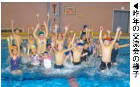
▲ 昨年の交流会の様子

神田駿河台3-7 ☎ hanabom@nifty.com)へ。 問 同事務局・津田 ☎ 080-3095-0325 他 11日の宿泊は国立オリンピック記念青少年総合センター(渋谷区代々木神園町)/12日はホームステイ