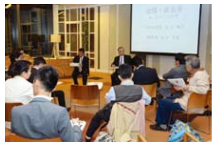
▲出張！区長室(丸の内エココツェリア)

メール(7面記入例参照)でちよだ成年後見センター(☎5282-3100 FAX)5282-3718 ☒kouken@chiyoda-cosw.or.jp)へ。