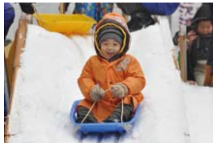
▲神田小川町雪だるまフェア(小川広場)