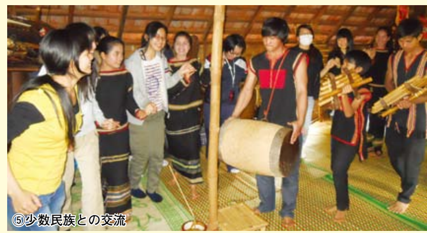
⑤少数民族との交流

ベトナムに行くって感じたことは、現地の方々の優しさ、人の温かさや、枯葉剤の影響などの戦争の現実です。また、日本へ留学するために一日12時間も勉強することなど、自分の勉強の仕方を考えさせられました。今回の経験は非常に得たものが大きく、将来に役立てれば良いと思いました。