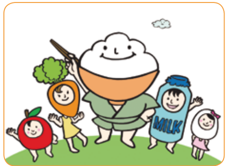
▲千代田食育フェスティバルを開催(左下関連記事)