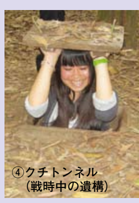
④クチトンネル(戦時中の遺構)

ベトナムのバンメート市で栽培されるコーヒーの蜜の甘さとは対照的にコーヒーは濃く、苦い。この甘さと苦みはまさにベトナムで感じる違和感や矛盾の味である。驚くような早さで変化を遂げるこの国に存在する違和感はそのスピードの遠心力によって吹き飛ばされてしまうのか。深い黒色のコーヒーにミルク色の練乳を混ぜて中和させるように、苦い違和感を和らげるミルクはあるのだろうか。