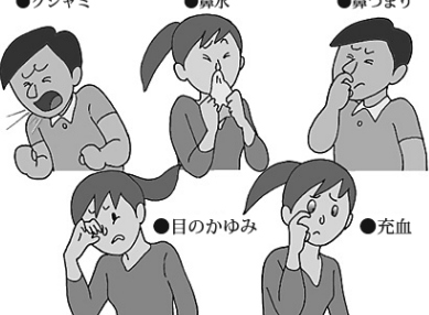
「花粉症の代表的な症状」