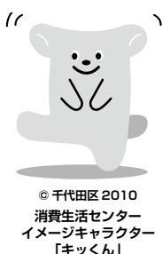
千代田区2010消費生活センターイメージキャラクター「キックン」