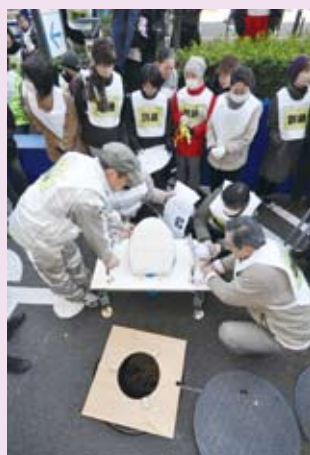
昌平童夢館 (土曜・昼間実施)