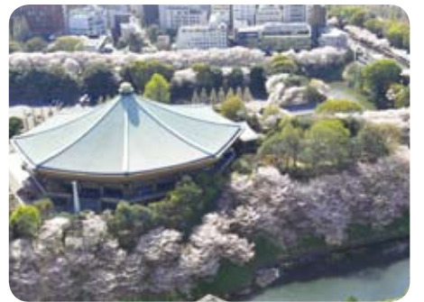
▲3月30日～4月8日 さくらまつり(10面参照)