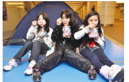
▲帰宅困難者受け入れの社会実験(行幸通り地下通路)