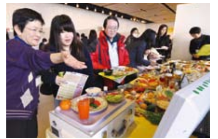
▲千代田食育フェスティバル(区民ホール)