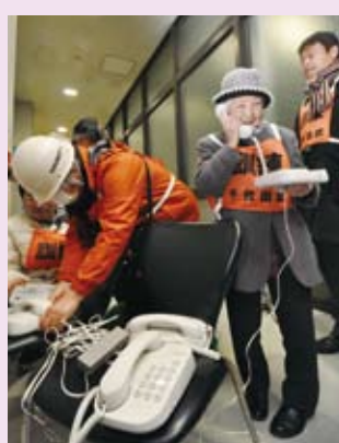
スポーツセンター (平日・夜間実施)

2月11日に昌平童夢館、2月20日にスポーツセンターで、避難所開設を中心とした防災訓練を実施し、それぞれ300人、100人が参加しました。訓練は、東日本大震災の教訓を生かし「いざ」というときに備えるため実施したものです。 当日は、震度6強の大地震が発生したと想定し、避難所への募集、備蓄資器材の組み立て、電話不通時のデジタル無線機での通信、帰宅困難者への情報提供、災害ボランティアの受付・派遣、備蓄物資の配給などを訓練しました。 「地域の住民が協力して避難所を開設する訓練はいい経験になりました」 「巨大地震に備えて地域で力をあわせることが大事だと感じました」などと話していました。