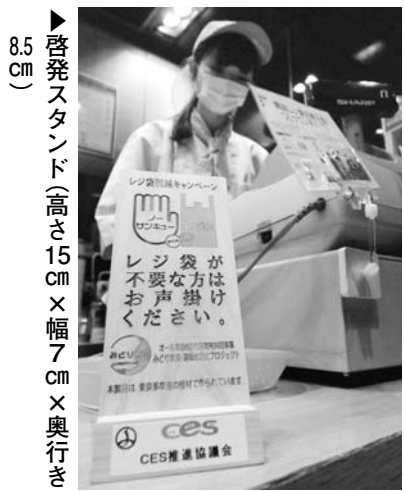
▶啓発スタンド(高さ15cm×幅7cm×奥行き8.5cm)