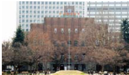
▲日比谷公会堂(日比谷公園)