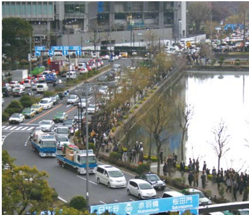
▲震災直後の大手門付近の様子

3月11日で東日本大震災から1年となります。震災時は、区内でも交通機関のマヒなどにより多くの帰宅困難者が発生し、「コンビニエンスストアから水や食べ物などがなくなるなど混乱も生じました。区は、震災の教訓を生かし、さまざまな対策を呼びかけ、訓練を実施しています。この機会に、家庭や事業所で災害時の備えや行動を再点検しましょう。 問合せ 防災課防災計画係 ☎5211-4187