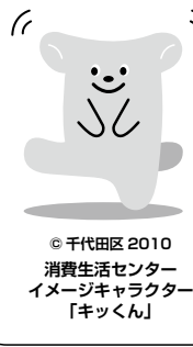
千代田区2010消費生活センターイメージキャラクター「キックくん」

①適正な料金プランにする パソコンサイトへのアクセスが多いと、データ通信量は予想以上に多くなります。またGPSを利用した天気予報や地図表示など、利用者の意識していないところで使用しているアプリケーション(以下アプリ)の更新が常に行われ、データ通信が発生している場合もあります。