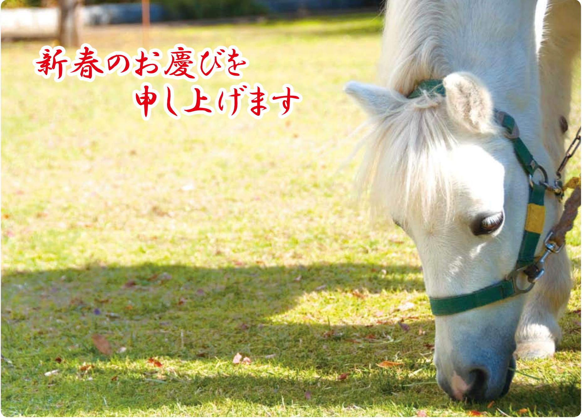
▲千代田区青少年委員会実施のポニー乗馬会(和泉公園)

皆様方には、希望に満ちたすがすがしい新春をお迎えのことと、心よりお慶び申し上げます。