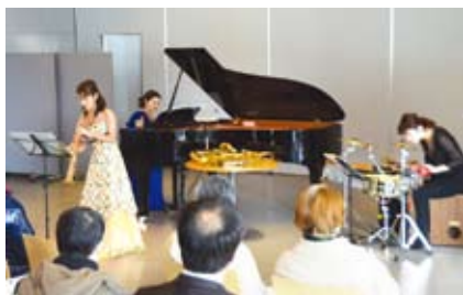
▲昼休みクリスマスコンサート(区民ホール)