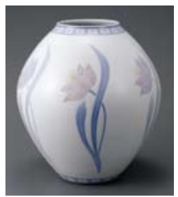
◀ 葆光彩磁草花文花瓶(1917) 出光美術館 板谷波山 大正6年

申 1月6日(月)から電話・直接千代田図書館または千代田区立図書館のホームページ(区役所10階 ☎5211-4289<平日10時～18時> ☎ http://www.library.chiyoda.tokyo.jp <区立図書館の貸出券を持っている方のみ/>「マイページ」にログイン→「イベント申込」)へ。