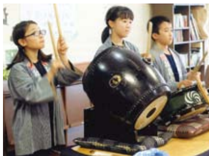
※觀覽希望の方は当日直接会場へ。

第2部 午後1時30分～/ 子供たちによる神田囃子と獅子舞(神田囃子子供連) = 写真、新春出前寄席(法政大学落語研究会)