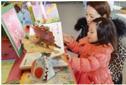
▲しかけ絵本大集合! 120冊のとび出す絵本展(区民ホール)

区立図書館 おはなし会 お子さんが本に親しめるように、定期的に絵本の読み聞かせ(30分程度)