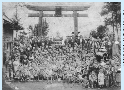
▲大正末期の平河天満宮