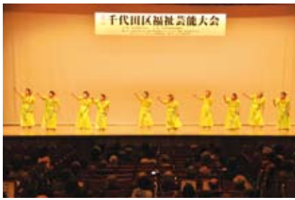
▲千代田区福祉芸能大会 (共立講堂)