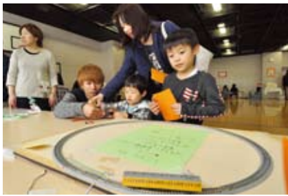
▲エコフェスタ(神田児童館)