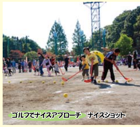
ゴルフでナイスアプローチ ナイスショット