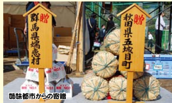
姉妹都市からの寄贈