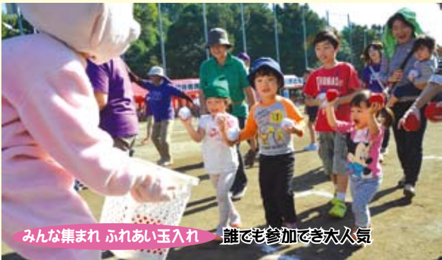
みんな集まれ ふれあい玉入れ