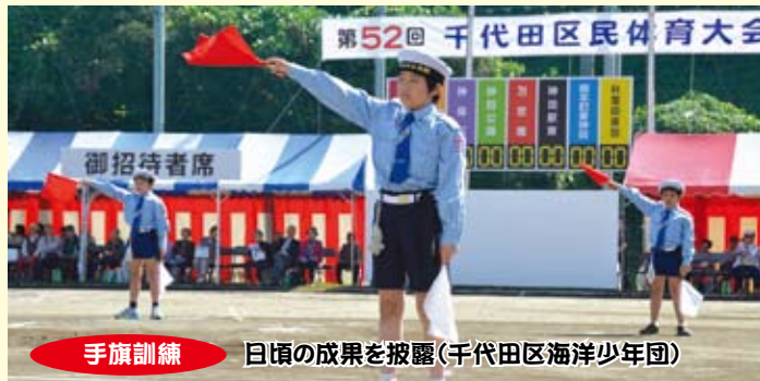
手旗訓練 日頃の成果を披露(千代田区海洋少年団)