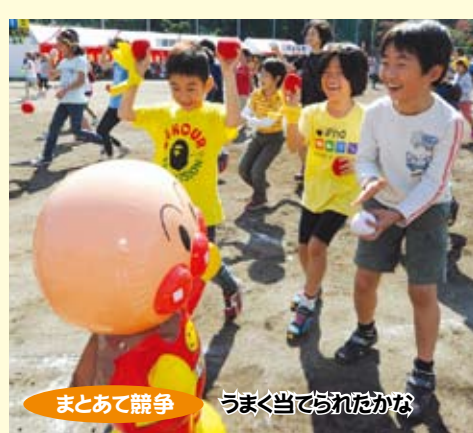
まとあて競争 うまく当てられたかな