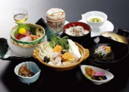
▲アンコウ鍋料理を堪能

費3歳以上8,700円(2歳以下は無料(食事なし)) 締11月11日(火) 他11月18日(日)までにゆとりちよだから当落を通知後、当選者に旅行会社から案内書を送付。 -1212いずれも- 申締切日までにファクスまたはEメール(11面記入例参照/参加者全員の氏名・年齢も記入)で(公社)ゆとりちよだ(FAX 3233-8692) info@yutori-chiyoda.net)へ。 問☎3294-8558