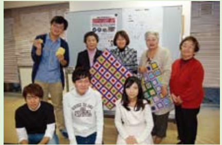
▲一緒に座布団カバーを編みましょう

3 60代からのチャレンジ! 男のそば打ち「そばちよ会」見学・体験会 時12月6日(土)14時~17時 場神保町区民館(神田神保町2-40) 対60歳以上の区内在住の男性10名(申込順) 内月1回、そば打ちを学び、区内の高齢者施設やサロンでふるまう。 4 編み物ボランティア 時12月20日(土)①10時~12時②13時~15時 場ちよだボランティアセンター1階