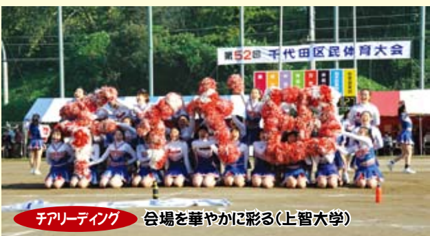
チアリーディング