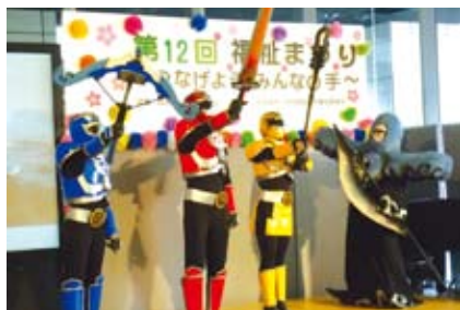
▲岩手県大槌町から駆けつけた防災戦隊「ホウライオー」(福祉まつり)