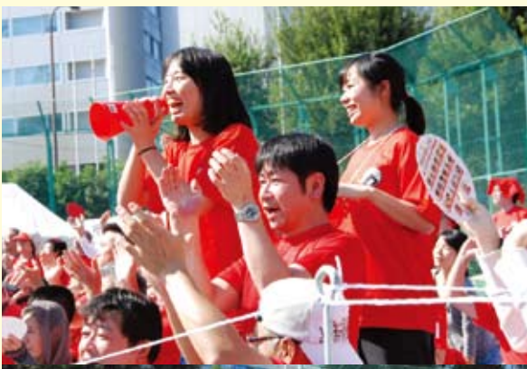
各地区の応援もヒートアップ