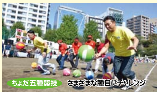
ちよだ五種競技 さまざまな種目にチャレンジ