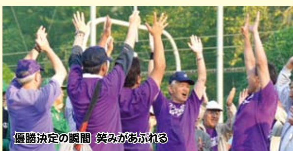
優勝決定の瞬間 笑みがあふれる