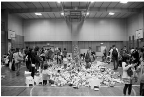
▲かえっこパザール

⑤講演会II低コストで取り組むやすい!千代田区独自の環境マネジメントシステム「CESクラスII・III」の紹介(参加事業者の皆さんの取り組み発表) ※11時15分～12時45分頃(なお、プログラムは変更する場合があります) 定員 ⑤のみ70名(申込順) 申込み ⑤のみ11月12日(水)までにファクスまたはEメール(11面記入例参照)でCES推進協議会事務局