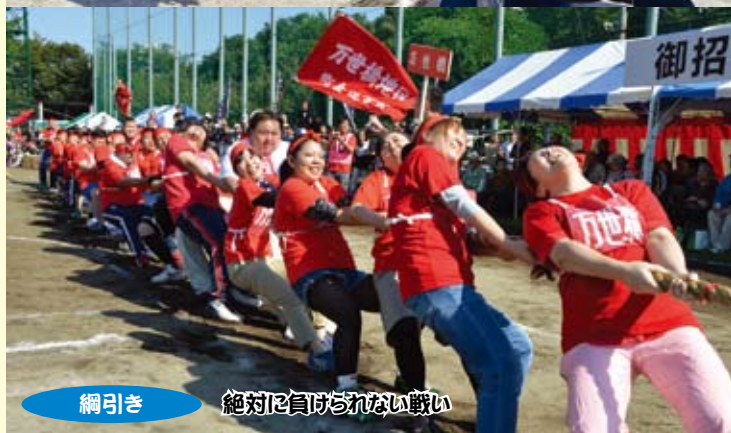
綱引き 絶対に負けられない戦い