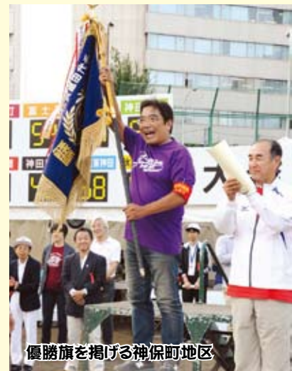
優勝旗を掲げる神保町地区