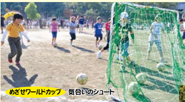
めざせワールドカップ 気合のシュート