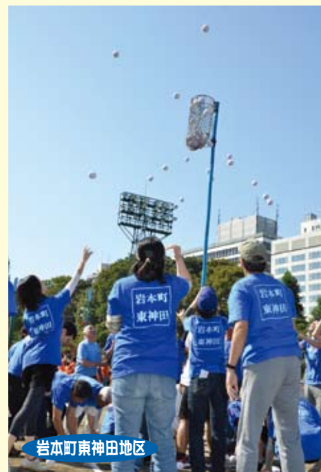
岩本町東神田地区