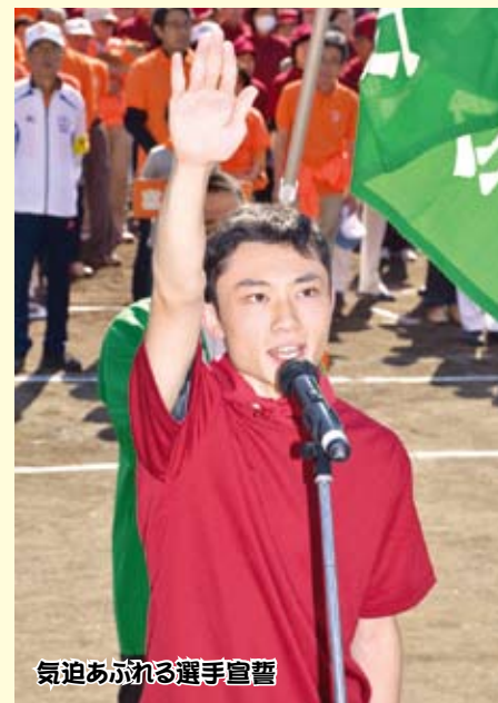
気迫あふれる選手宣誓