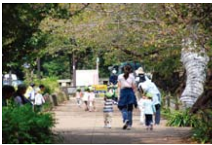
▲わくわく気分でお散歩(四番町保育園)