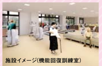
施設イメージ(機能回復訓練室)

■ 福祉や介護を学べます 「人材育成・研修拠点」では、福祉や介護に関する知識の取得や、技術の向上を図る研修などを行います。