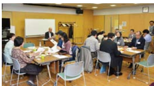
▲初回のマンション・カフェ(麹町区民館)

まちみらい千代田では、千代田区と共同で「ちよだマンション・カフェ」を開催しました。これは、新たな試みとして、地域別にマンションの課題等をマンションにお住まいの方が自由に意見交換し、地域との良好な関係づくりを議論できる場として設置したものです。初回の11月15日(出)には麹町区民館で、11月22日(出)には和泉橋区民館で開催しました。