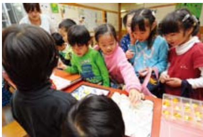
▲お店やさんごっこ(麴町保育園)