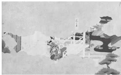
▲源氏物語図屏風(部分) 岩佐勝友 江戸時代 出光美術館所蔵

申 1月5日(月)10時から千代田区立図書館のホームページ(区立図書館の貸出券をお持ちの方のみ)・電話または直接千代田図書館(区役所10階 ☎ 5211-4289) http://library.chiyoda.tokyo.jp)へ。