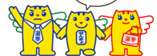
▲明るい選挙キャラクター「選挙のめいすいくん」(中央)と「お父さん」(左)・「お母さん」(右)