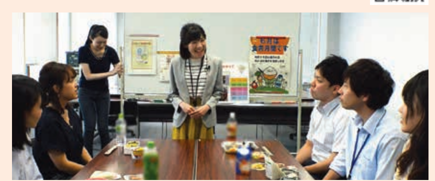
▲管理栄養士が、区の職員に昼食のバランスをアドバイス