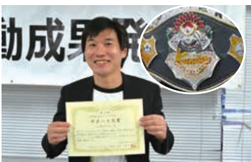
▲サポート大賞を受賞した「神田プロレス」

千代田まちづくりサポートでは、千代田区を活性ある住み良い魅力的なまちにしようとする自主的なまちづくり活動を行っているグループに対して、活動経費の一部を助成しています。 4月14日(日)、活動成果発表会を行い、発表会の会場(ちよだプラットフォームスクウェア)には、56名の皆さんにご来場いただきました。 ■活動成果発表 (一般部門・はじめて部門) ○助成対象12グループからまちづくり活動の成果発表 すべての発表・報告後、審査委員会および助成グループが投票を行い、第18回のサポート大賞に「神田プロレス」が選ばれました。 ■年度報告 (普請部門) ○第16回助成対象グループ「海老原商店を活かす会」・第17回助成対象グループ「秋葉原・旧旅館「東館」内ちよだニヤンとなるCafe」から1年間の活動報告