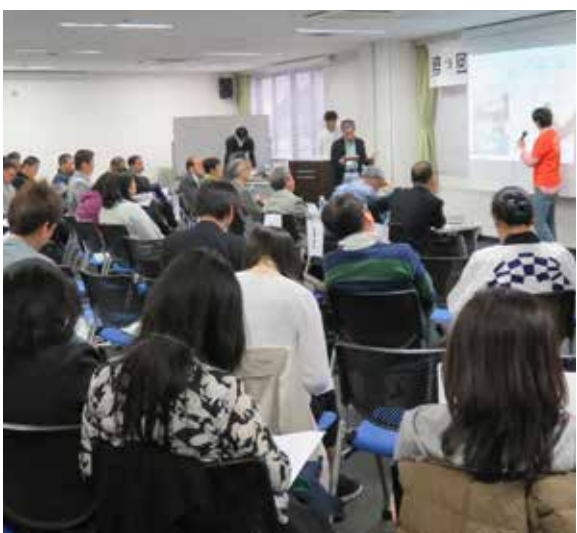
▲活動成果発表会の様子