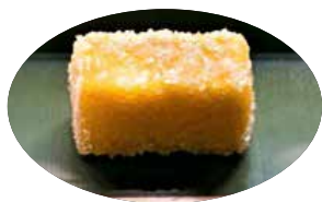
▲南蛮菓子「カストース」

月ごとにご当地スイーツを販売します。ポルトガルから伝わった南蛮菓子「カストース」が平戸市から届きました。良く溶いた卵黄にくぐらせたカステラを、熱した糖蜜に浮かべ、最後に砂糖をまぶして仕上げたお菓子です。5月のさわやかな風の吹く、テラス席でお召し上がりください。お持ち帰りも可能です。