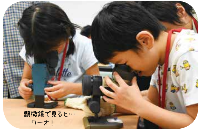
顕微鏡で見ると… ワオ!