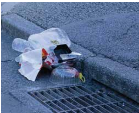
◀ 路上の放置ゴミが海へ流れ出てしまうことも