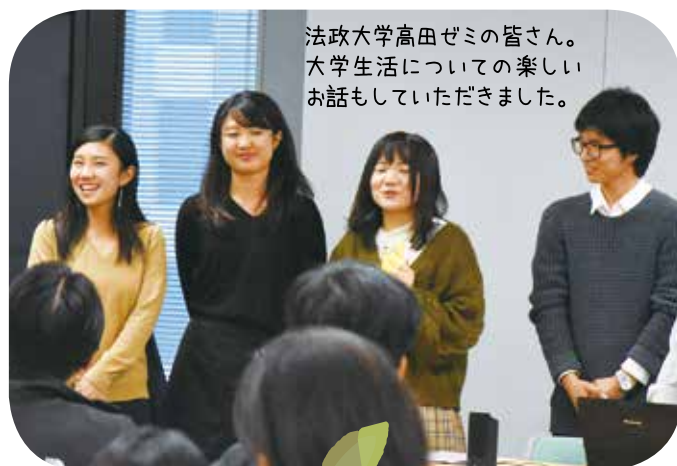
法政大学高田ゼミの皆さん。大学生活についての楽しいお話もしていただきました。

千代田区内の11大学と千代田区は、千代田の魅力創出と発展に協働して取り組むため、「千代田区内大学と千代田区の連携協力に関する基本協定」を平成15年1月に締結しました。環境政策課では、その大学連携の一環として、平成21年度より環境や温暖化対策を主題とした環境連携会議を開催しています。今後とも区内の大学と連携した取り組みを進めていきます。