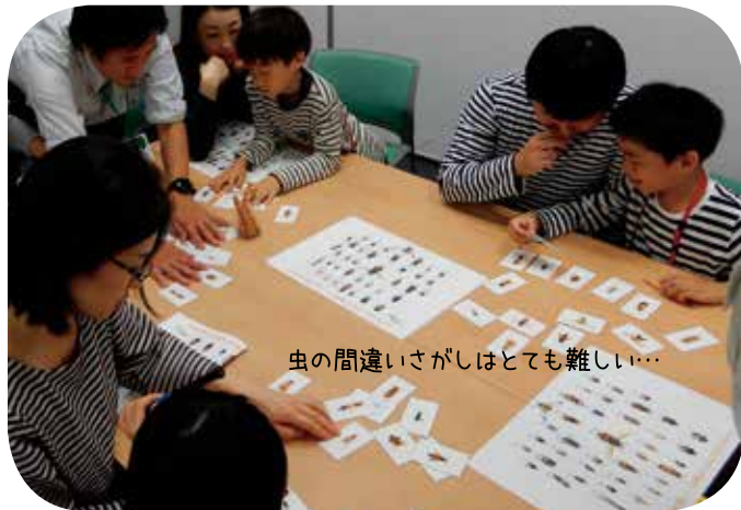
虫の間違いがしはとても難しい…

彼らがこの日のために作ってくれたオリジナルの「生きものカルタ」を使って、小学生たちは生きものについて楽しみながら学ぶことができました。そればかりか、大学生の皆さんから、学生生活やゼミにおける活動の様子などといった話も直接聞くことができ、ともに楽しく有意義な時間を過ごしていました。