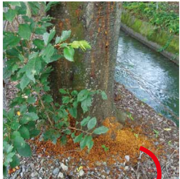
▲サクラの根元に散乱したフラス