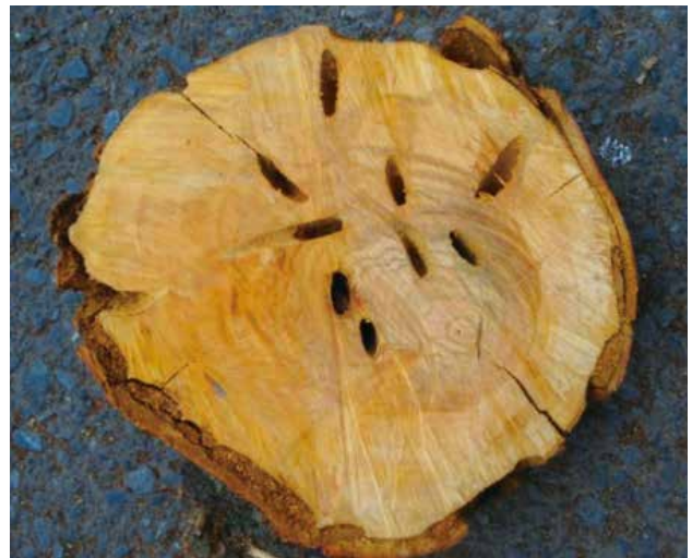
▲幼虫に食害された樹木の断面

クビアカツヤカミキリは、非常に繁殖力が強いと言われています。千代田区内で被害が発生することがないように、早期発見にご協力をお願いします。